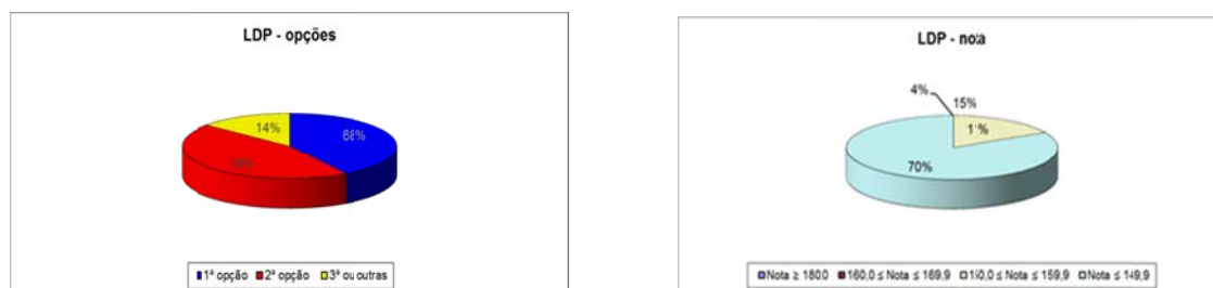
Distribuição dos colocados por opção/nota de candidatura_LDP